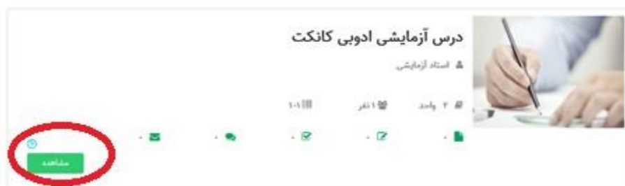
تصویر شماره ۱

سپس مطابق تصویر شماره ۲ بر روی تب کلاس‌ها کلیک نمایید.